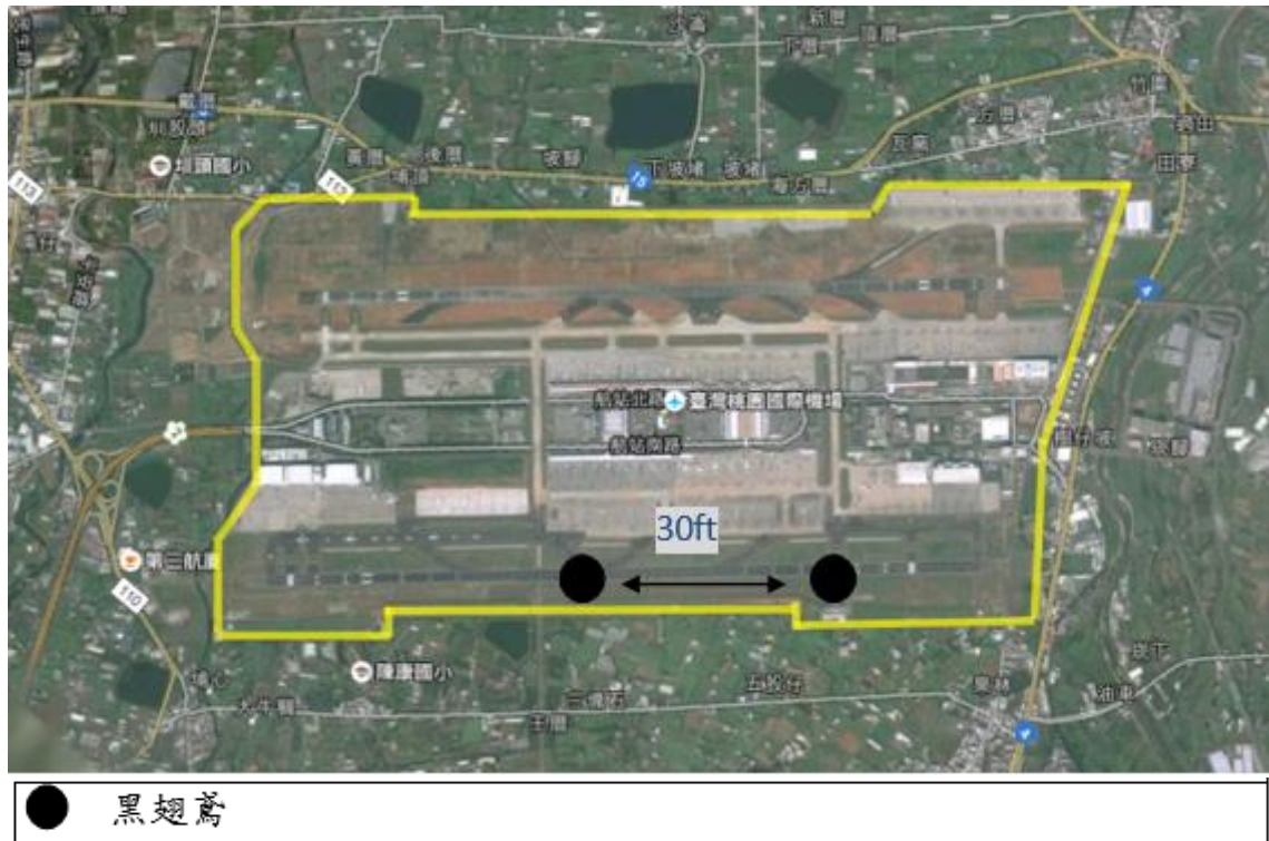
圖 1 2020 年 7 月桃園機場上午時段鳥類活動分布圖

本預告為參考 2013—2019 年 7 月份桃園機場鳥相資料庫與 2020 年 5 月份鳥相觀測資料發布。2020 年 7 月場內可能威脅飛安的主要鳥種為黑翅鳶，乃是因為其覓食區域的考量。