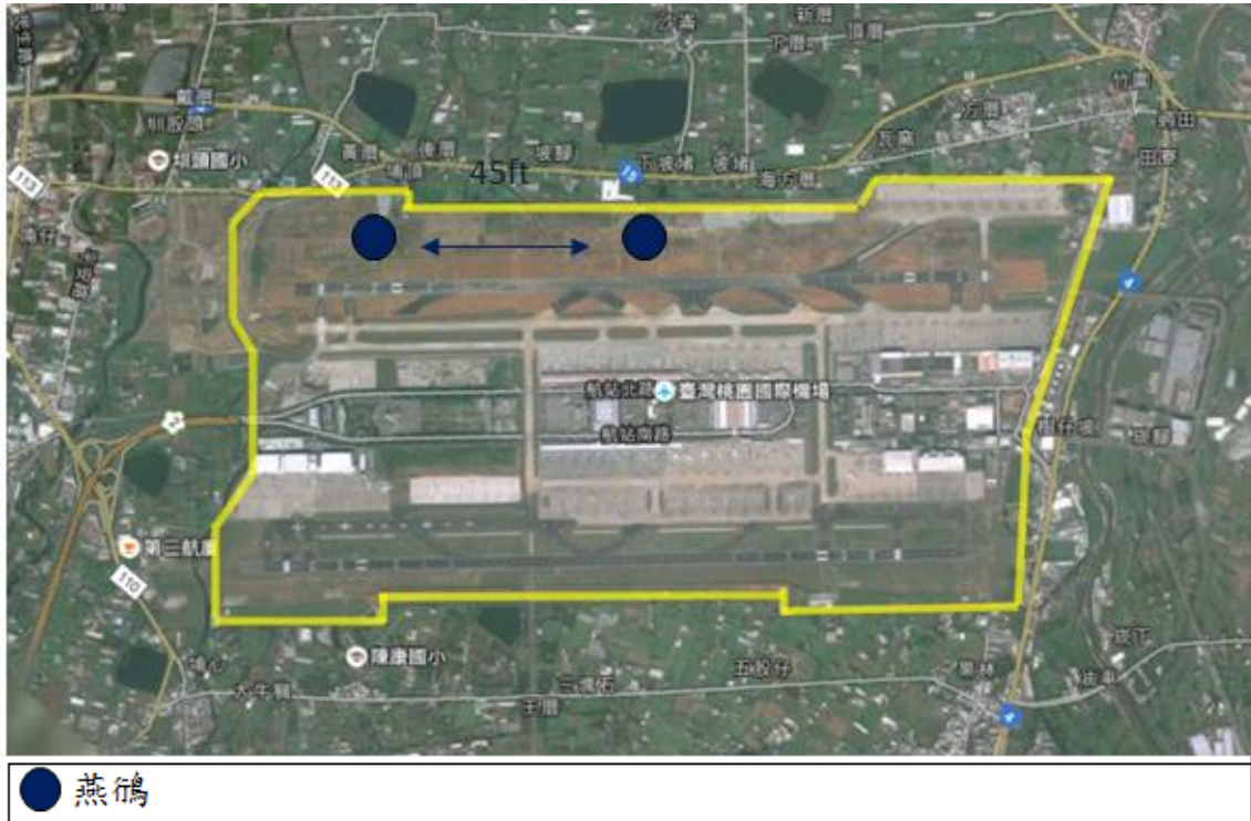
圖 1 2019 年 07 月桃園機場上午時段鳥類活動分布圖

2019 年 07 月場內可能威脅飛安的鳥種包括燕鴿及南亞夜鷹，分別因為其群聚性、棲息地或夜行性等因素。