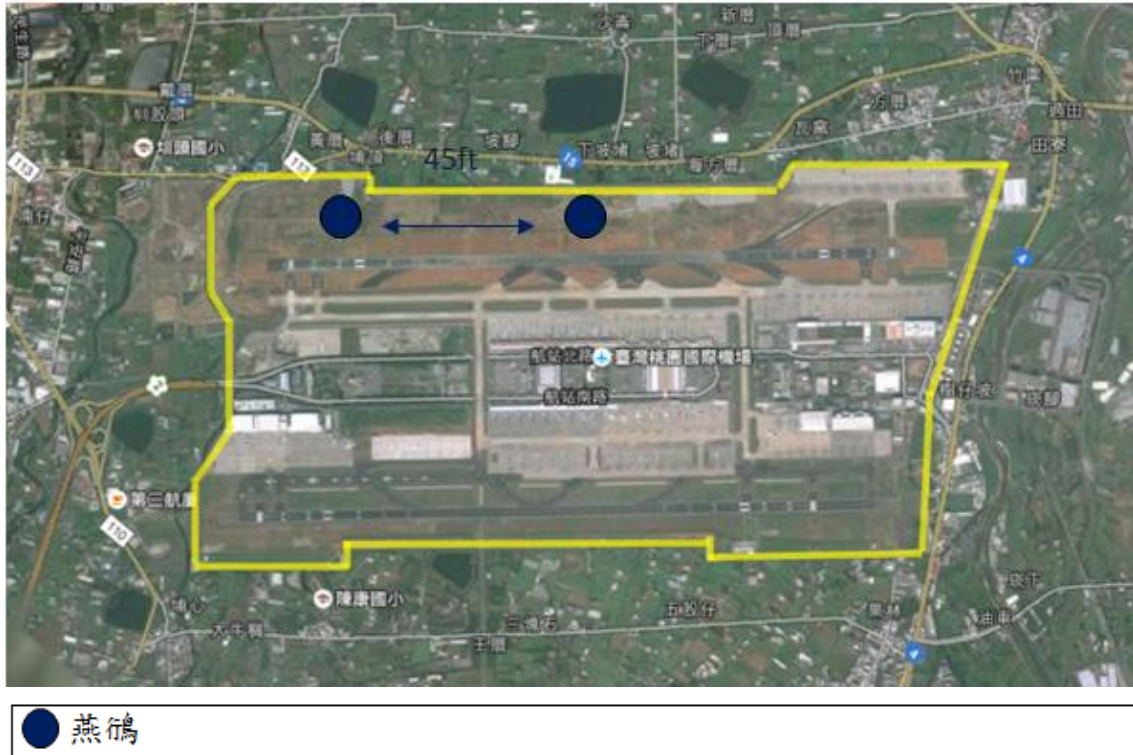
圖 1 2019 年 8 月桃園機場下午時段鳥類活動分布圖

2019 年 08 月場內可能威脅飛安的鳥種包括燕鴿及南亞夜鷹，分別因為其群聚性、棲息地或夜行性等因素。