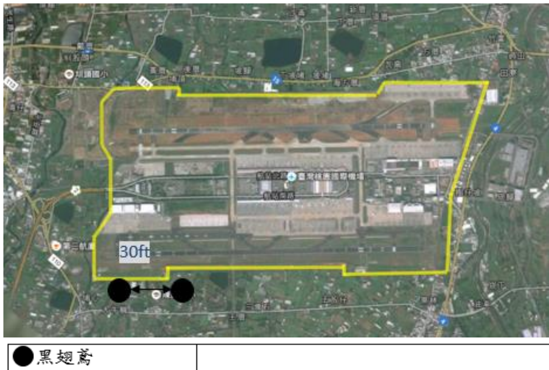
圖 1 2021 年 5 月桃園機場上午時段鳥類活動分布圖

黑翅鳶(380g)主要活動在西南邊場外區域，移動時飛行高度低於 30 呎；常會進機場跑道邊的草地覓食，且長時間在空中飛行懸停，所以需特別注意，上午主要活動時間為 1000-1200L。