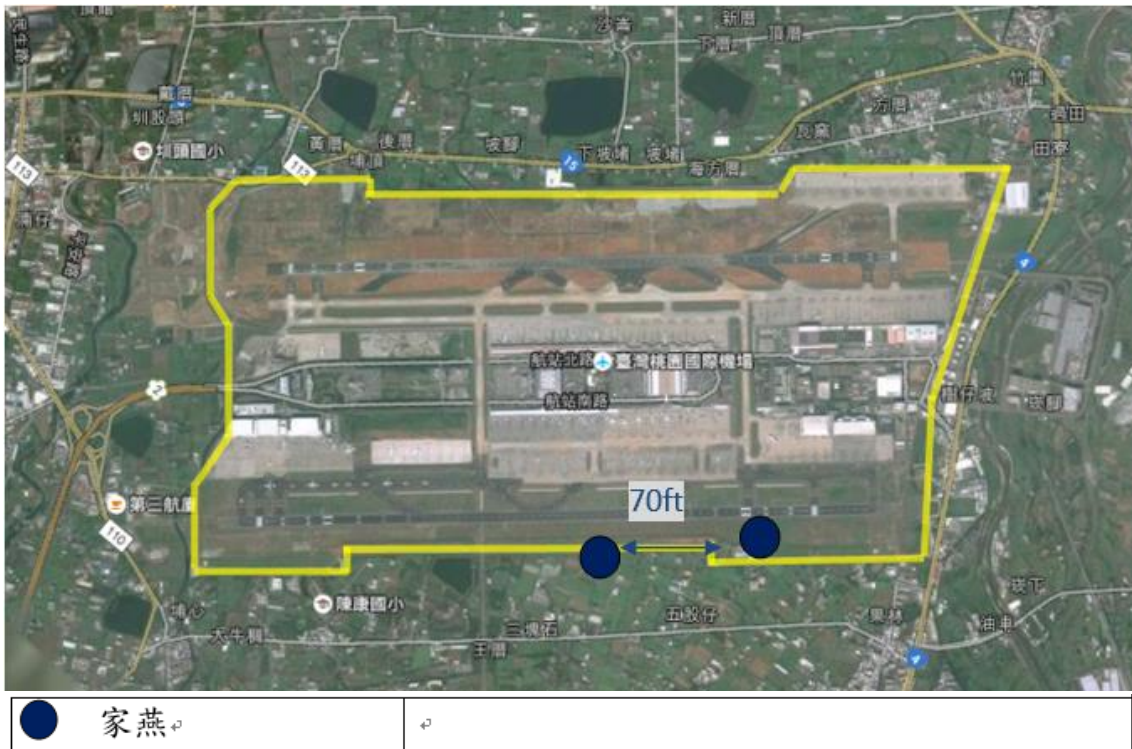
圖 2 2020 年 6 月桃園機場下午時段鳥類活動分布圖

家燕(16-22g)群常於傍晚於南環場道旁的溝渠上空巡飛覓食，尤其是 2.9km 附近的溝渠聚集的數量較多，下午主要活動時間為 1600-1900L。