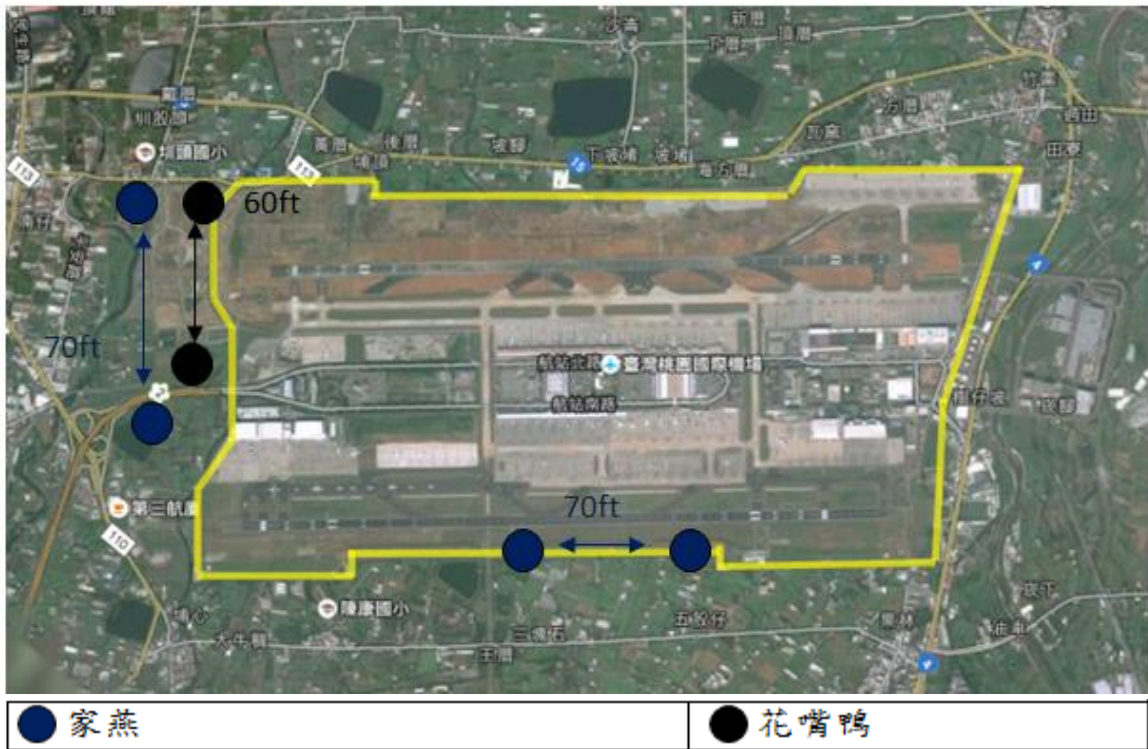
圖 1 2019 年 05 月桃園機場上午時段鳥類活動分布圖

2019 年 05 月場內可能威脅飛安的鳥種包括花嘴鴨、南亞夜鷹及家燕分別因為其群聚性、體型、棲息地或夜行性等因素。